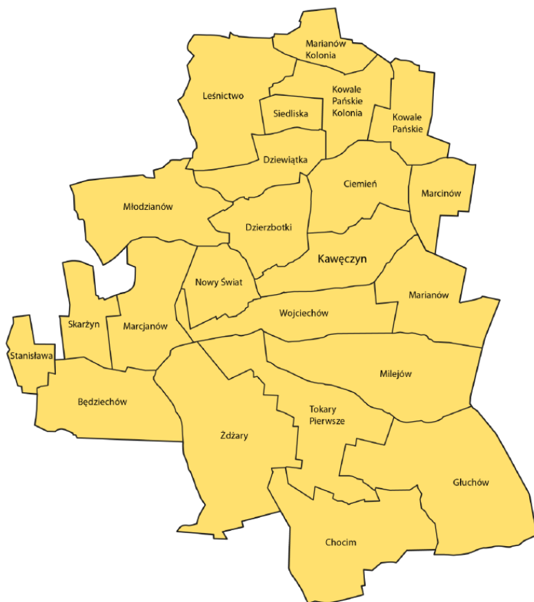
Rysunek 1. Podział Gminy Kawęczyn na jednostki analityczne

Z uwagi na specyfikę analizy wielokryterialnej, przeprowadzanej celem wyznaczenia obszaru zdegradowanego i obszaru rewitalizacji, za wyjściowy przyjęto podział na 23 jednostki przestrzenne (sołectwa).