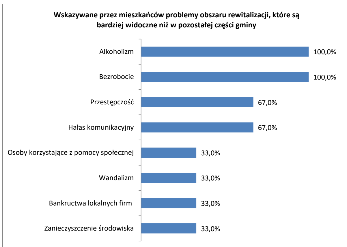
Wykres 1. Wskazywane przez mieszkańców problemy obszaru rewitalizacji, które są bardziej widoczne niż w pozostałej części gminy.