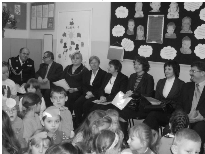
Szkołę odwiedziło wielu gości

W realizację projektu i przygotowanie wizyty studyjnej włączyli się wszyscy nauczyciele, pracownicy administracyjni szkoły oraz rodzice.