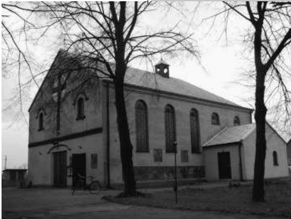
Kościół w Głuchowie zaadoptowany w 1919 roku ze spichlerza