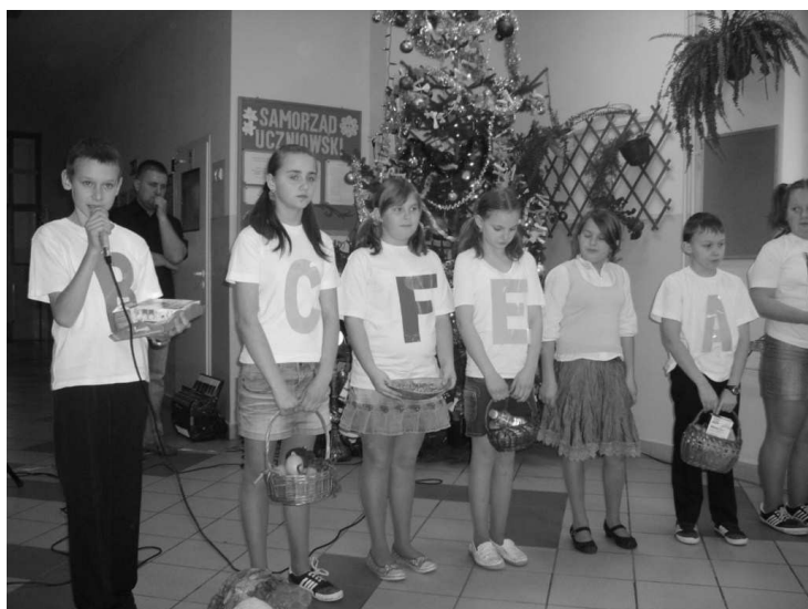
Dzieci zaprezentowały bogaty program artystyczny

kiej konsultacji lekarskiej i otrzymać receptę na zdrowie.