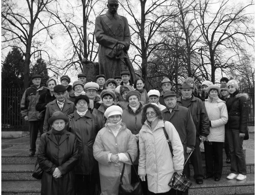
Pod pomnikiem marszałka Piłsudskiego w Warszawie